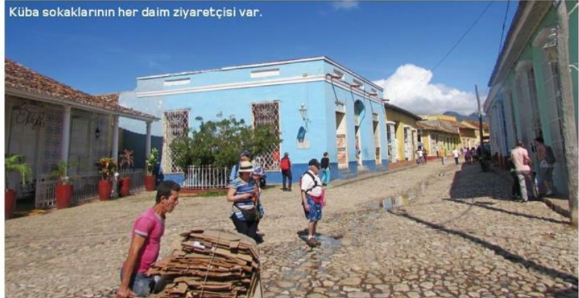
Küba sokaklarının her daim ziyaretçisi var.