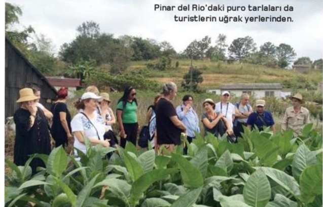
Pinar del Rio'daki puro tarlaları da turistlerin uğrak yerlerinden.