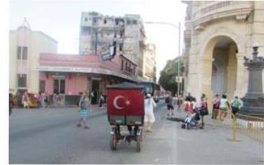
Havana sokaklarında Türk bayrağıyla gezen tur bisikleti (üstte) ve şehri klasik arabalarla gezen turistler (altta).

Pinar del Rio'da hem puro fabrikasını hem de puro yapraklarının tarlasını gezdik. Los Jazmines tepesinden Vinales Vadisi'nin manzarasını seyrettik. Küba'nın ilk yerlilerine ait Cueva del Indio mağarasının içindeki nehrin sandalla gezip keşfettik. Mural de la Prehistoria'da ise Leovigildo'nun çizdiği dünyanın en büyük açık hava doğa yağlı boya tablosundan etkilendik. Trinidad'ın şirin sokaklarında üzerinde ters çapayla bir işaret bulunan evlerin aileler tarafından işletildiğini öğrendik. Casa'lardan birinde kalarak halkla içiçe konaklamayı bizzat deneyimledik.