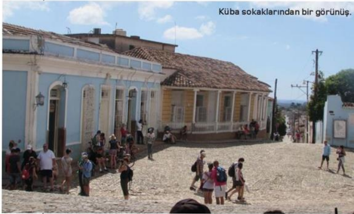
Küba sokaklarından bir görünüş.