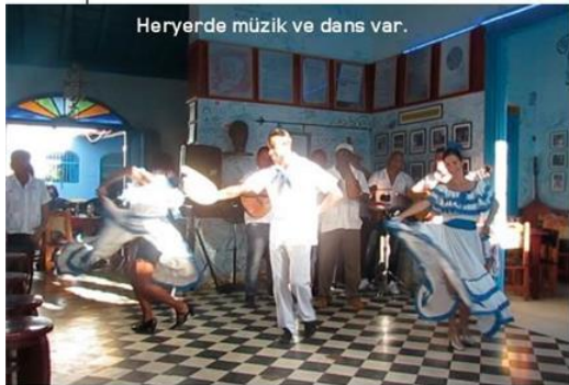
Heryerde müzik ve dans var.