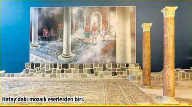
Hatay'daki mozaik eserlerden biri.