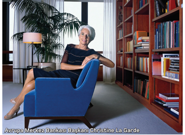
Avrupa Merkez Bankası Başkanı Christine La Garde